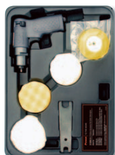
Kit 3129K (CPN: 80195605)