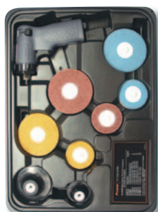
Kit 3103K (CPN: 80195597)