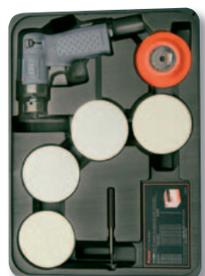
Kit 3128K (CPN: 80195613)